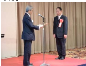
〈東京プリンスホテルにて〉