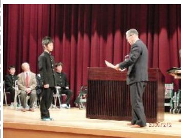
←表彰状を受ける前生徒会長と旧役員→

今年度も6台の福祉機器を「社会福祉センター」と「香梅苑」へ贈ることができました。改めて地域の皆さんにお礼を申し上げ