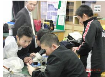
〈楽しい理科の実験〉

今年度の体験授業は理科の実験でした。かなりおもしろかったようで、感想文の中に「早く中学生になりたい。」と書いてくれました。元気な子ども達を迎える準備をきちんとし、中学校一同入学を心待ちにしています。