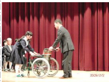
←贈呈する福祉機器→