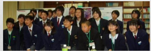
都南中学校 田原中学校 二名中学校 富雄第三中学校