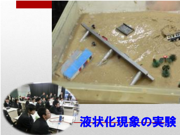
液状化現象の実験