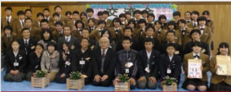
三笠中学校 若草中学校 飛鳥中学校 富雄中学校