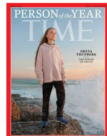
タイム誌「今年の人」に