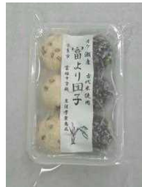
チャリティー価格 6コ400円

こんなこと聞いたら恥ずかしい、自分だけが疑問に思っているのかなということも、意外と共通の話題となるものです。結論は出なくとも、何かしらのヒントがあるはずですよ。 なるほどという発見があればしめたものです。 子育てには、これという特効薬もマニュアルもありません。 みんなそれぞれ悩んでいます。お互いに良い意味での情報交換をかわしていきたいと思います。