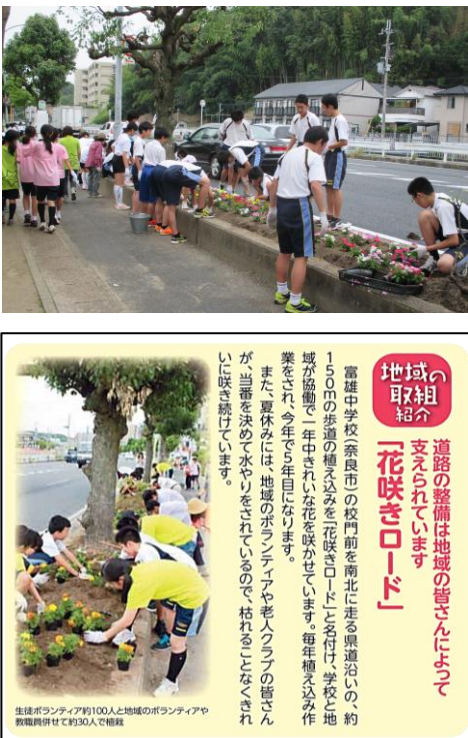
県民だより平成26年8月号より

六月二十六日(金)雨の中、生徒会執行部・ボランティア部・生徒ボランティア・地域ボランティアなど約百二十名が参加し、学校前の歩道横の花壇に花植えを行いました。本日に「苦勞様でした。マリンゴルドや日々草など夏を代表する花が登下校を出迎えてくれています。