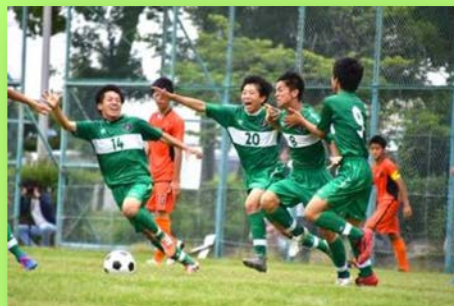
自主的な生徒会活動・部活動・課外活動