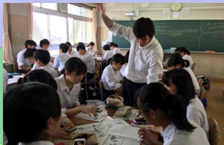
外国人講師と学ぶ批判的思考