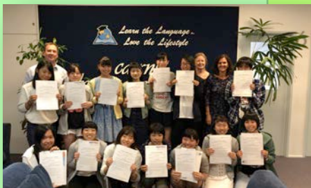
留学・語学研修・異文化体験