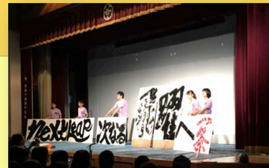
一条祭の書道パフォーマンス