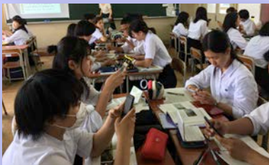
スマホ・タブレットで学ぶ