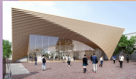
ステキな新しい講堂