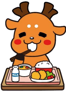
奈良市学校給食食育の日 マスコットキャラクター