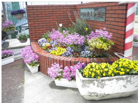
奈良市立伏見中学校