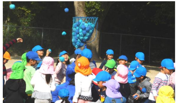
(1年生とネオポリス幼稚園との交流)

今年度も4月に6年生を対象に全国学力・学習状況調査が行われました。今年度の学力状況調査の結果から、本校は、国語では全国平均正答率より1.2ポイント、算数では全国平均正答率より5.8ポイント高い結果でした。分析を進めたところ、国語、算数とも問題の内容を理解するのに時間がかかった子どもたちが多いことが見えてきました。